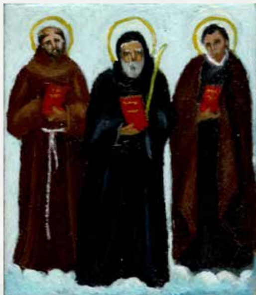
Personaggi della Chiesa Divina Commedia I tre santi delle Regole olio su tavoletta multistrato, 147x130 mm, 2023

Le bellezze della Divina Commedia , già esplorate dal Maestro nei suoi acquarelli e nelle incisioni, si intrecciano alla narrazione francescana del ciclo miniaturistico, dando vita a una sezione dedicata ai personaggi della Chiesa presenti nel poema dantesco. Evocato a partire dalla figura di Pietro da Morrone, il richiamo alla Divina Commedia introduce un contesto simbolico capace di aprire a nuove interpretazioni. L'unione delle due suggestioni, lungi dall'essere eterogenea, dà vita a una lettura stratificata delle vicende dell'Ordine.