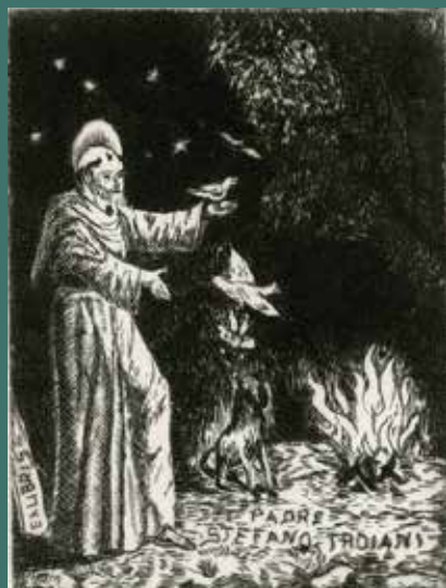
Francesco parla alle tortore e contempla Fratello Fuoco puntasecca su materiale plastico, 129x99 mm, 2012